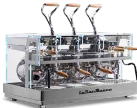
Multi Boiler con maniglie in legno e V Leva - Multi Boiler with wooden handles and V Leva

LEVA LUXURY IS A MASTERPIECE OF DESIGN AND ENGINEERING, BLENDING TRADITION AND INNOVATION IN AN UNPRECEDENTED MACHINE. ITS TEMPERED GLASS BODY, ENHANCED BY A MULTICOLOR LED LIGHTING SYSTEM, CREATES MESMERIZING LIGHT EFFECTS THAT HIGHLIGHT THE REFINED BEAUTY OF THE MIRROR-POLISHED STAINLESS STEEL BOILER, AS WELL AS THE CLASS® GROUPS AND CYLINDERS. ONE OF A KIND, IT IS THE FIRST LEVER MACHINE TO INTEGRATE MULTI BOILER TECHNOLOGY, ALLOWING INDEPENDENT AND ULTRA-PRECISE TEMPERATURE CONTROL FOR EACH BREWING GROUP THROUGH PID REGULATION. EVERY DETAIL HAS BEEN METICULOUSLY DESIGNED TO DELIVER A UNIQUE AESTHETIC AND EMOTIONAL IMPACT, TRANSFORMING COFFEE PREPARATION INTO AN UNCOMPROMISING EXPERIENCE.