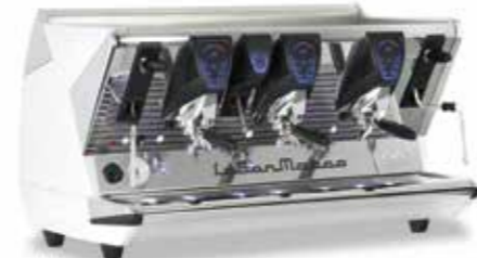
Versione con display touch - Version with touch display