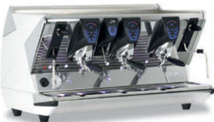
Version mit Touch Display