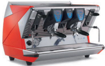
Version mit Touch Display